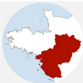
Région Pays de la Loire

Maître d'ouvrage : Caisse des Dépôts et Consignation