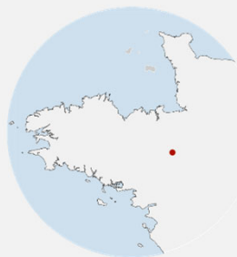
Noyal Châtillon sur Seiche (35)

Maître d'ouvrage : Commune de Noyal Châtillon sur Seiche