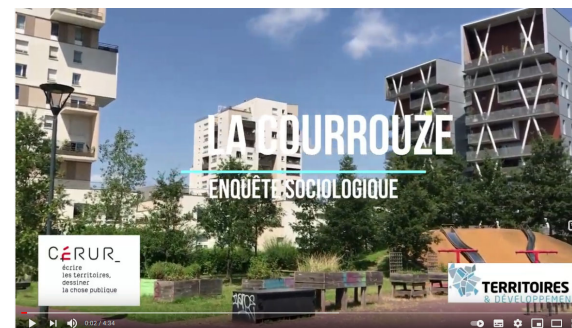
Lien vers vidéo "enquête sociologique"