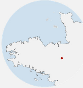
Le Rheu (35)